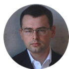
Вадим ЗИНОВЬЕВ Начальник управле- ния рыночных ри- сков БАНК РОССИИ