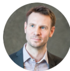
Оливер ХЬЮЗ Председатель Правления Тинькофф Банк